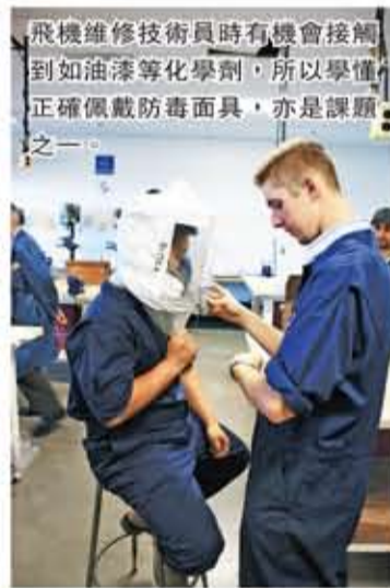
飛機維修技術員時有機會接觸到如油漆等化學劑，所以學懂正確佩戴防毒面具，亦是課題之一。

▼ BCIT位於列治文的航天科技學院新廈於兩年前落成，讓修讀航天科技的學生在地方寬敞與設備完善的校舍修讀相關課程。