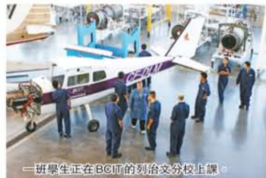
一班學生正在BCIT的列治文分校上課。

有意報讀飛機維修先修課程者，可電郵至info@dorsetcollege.bc.ca；有興趣報讀的本地申請者則可參閱www.bcit.ca。